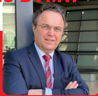
Dr. Hans-Peter Friedrich, MdB (CSU) Bundesminister a.D.