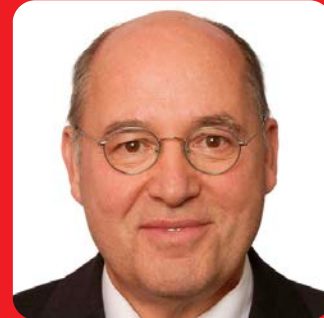
Dr. Gregor Gysi, MdB (Die Linke) Präsident der Europäischen Linken