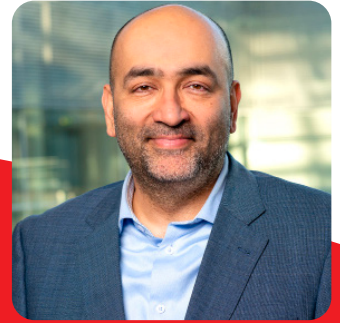
© Bündnis 90/Die Grünen, Bundestagsfraktion / Kaminski Omid Nouripour, MdB (Die Grünen) Bundesvorsitzender Bündnis 90 / Die Grünen