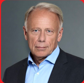
Jürgen Trittin, MdB (Die Grünen) Bundesminister a.D.