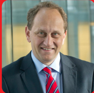
Alexander Graf Lambsdorff, MdB (FDP) Stellvertretender Fraktionsvorsitzender der FDP-Bundestagsfraktion