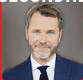
Daniel Bahr Vorstandsmitglied der Allianz Private Krankenversicherungs AG