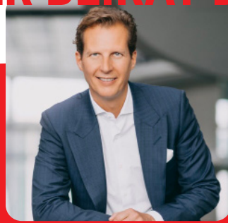
© Tobias Koch Olav Gutting, MdB (CDU) Mitglied des Bundesvorstandes der CDU Deutschlands